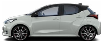
2VF Sivá – Dynamic s čiernou strechou Metalický lak bez príplatku – GR SPORT