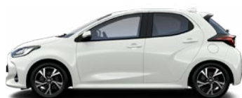
040 Biela – čistá Štandardný lak bez príplatku – Active, Comfort, Style