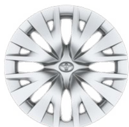
15" oceľové disky kolies s ozdobnými krytmi, pneumatiky 185/65 R15 Štandard pre výbavu Active