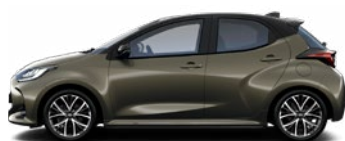
2TK Bronzová – oxid s čiernou strechou Metalický lak bez príplatku – Executive