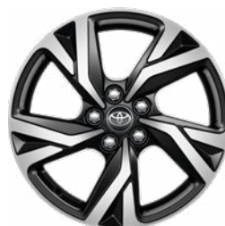
16" zliatinové disky kolies, pneumatiky 195/55 R16 Štandard pre výbavu Style