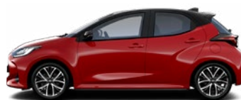
2SZ Červená – karmínová s čiernou strechou Špeciálny metalický lak 240 € – Executive, GR SPORT