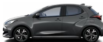
1G3 Sivá – popolavá Metalický lak 550 € – Active, Comfort, Style bez príplatku – Executive