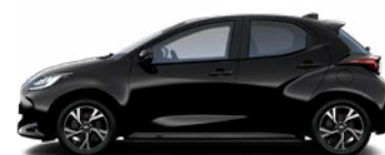
209 Čierna – nočná obloha Metalický lak 550 € – Active, Comfort, Style bez príplatku – Executive