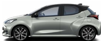
2VU Strieborná – metalická s čiernou strechou Metalický lak bez príplatku – Executive, Premiere Edition, GR SPORT