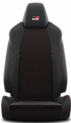
EB20 Čierne perforované čalúnenie z ekologického semišu Ultrasuede™ s koženými bočnicami a červeným prešívaním Štandard pre výbavu GR SPORT