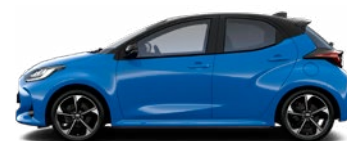
M19 Modrá – neptún s čiernou strechou Metalický lak bez príplatku – Premiere Edition