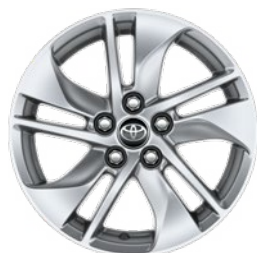
15" zliatinové disky kolies, pneumatiky 185/65 R15 Štandard pre výbavu Comfort