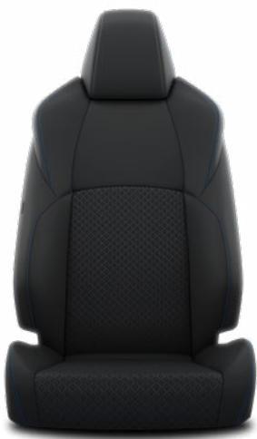
EA21 Čierne látkové čalúnenie v kombinácii s kožou s modrým prešívaním Štandard pre výbavu Premiere Edition