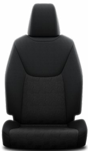
FB20 Čierne látkové čalúnenie Štandard pre výbavu Active a Comfort