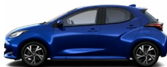
8Y8 Modrá – borievka Metalický lak 550 € – Active, Comfort, Style bez príplatku – Executive