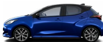
M20 Modrá – borievka s čiernou strechou Metalický lak bez príplatku – Executive, GR SPORT