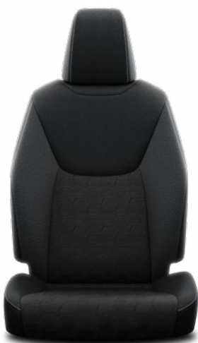
FC20 Čierne látkové čalúnenie s tmavosivými bočnicami a strieborným prešívaním Štandard pre výbavu Style