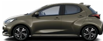
6X1 Bronzová – oxid Metalický lak 550 € – Active, Comfort, Style bez príplatku – Executive