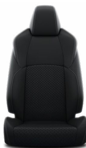
EA20 Čierne látkové čalúnenie v kombinácii s kožou so sivým prešívaním Štandard pre výbavu Executive