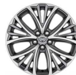
17" zliatinové disky kolies, pneumatiky 205/45 R17 Štandard pre výbavu Executive