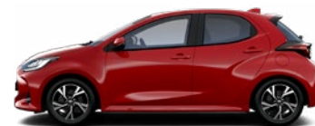
3U5 Červená – karmínová Špeciálny metalický lak 790 € – Active, Comfort, Style 240 € – Executive