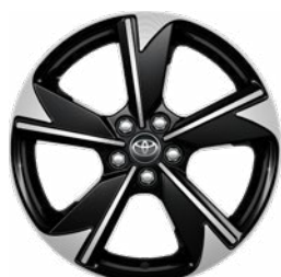
17" zliatinové disky kolies, pneumatiky 205/45 R17 Štandard pre výbavu Premiere Edition