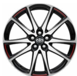
18" zliatinové disky kolies, pneumatiky 215/40 R18 Štandard pre výbavu GR SPORT