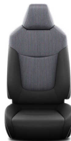
FE21 Čalúnenie textilné čierne Pre výbavu Style