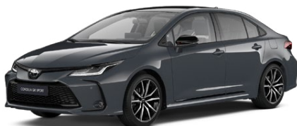
M29 Sivá – búrková s čiernou strechou Metalický lak pre GR SPORT bez príplatku