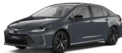
1M2 Sivá – búrková Metalický lak 650 €