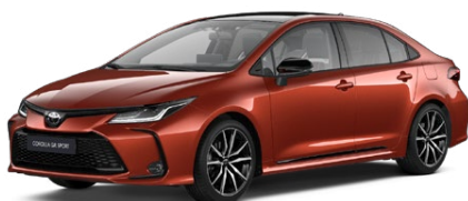
M35 Oranžová – sopečná s čiernou strechou (4Z3/202) Špeciálny lak pre GR SPORT 300 €