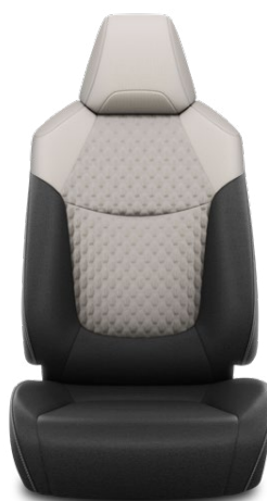
FB10 Čalúnenie textilné sivé Pre výbavu Comfort