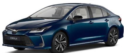
785 Modrozelená – tmavá Metalický lak 650 €