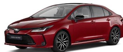
2TB Červená – karmínová s čiernou strechou (3U5/202) Špeciálny lak pre GR SPORT 300 €