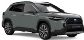
6X3 Sivá – khaki Štandardný lak – 600 €