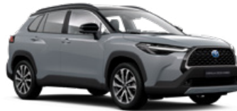
2YY Sivá – Manhattan s čiernou strechou Metalický lak pre Executive – 900 €