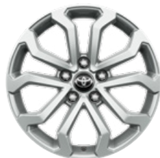
17" zliatinové disky kolies, pneumatiky 215/60 R17 Pre výbavu Comfort