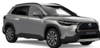
1L0 Strieborná – metalická Metalický lak – 600 €