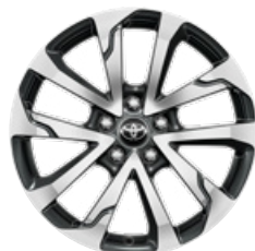
18" zliatinové disky kolies, pneumatiky 225/50 R18 Pre výbavu Style a Executive