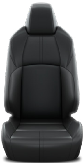
LB20 Kožené čalúnenie – čierne Pre výbavu Executive