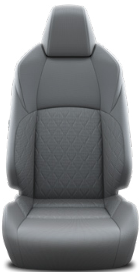
FA10 Textilné čalúnenie – šedé Pre výbavu Comfort a Style