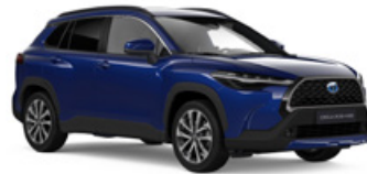
8W7 Modrá – tmavá Metalický lak – 600 €