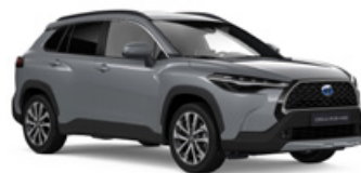
1H5 Sivá – Manhattan Metalický lak – 600 €