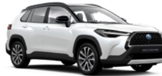
2P5 Biela – platinová s čiernou strechou Perleťový lak pre Executive – 900 €