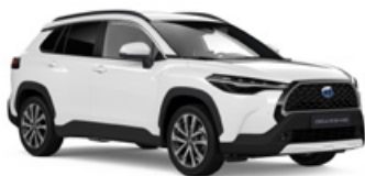
040 Biela – čistá Štandardný lak – bez príplatku