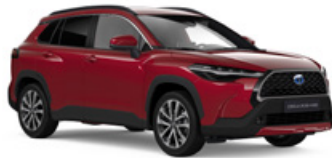
3T3 Červená – rubínová Špeciálny lak – 900 €