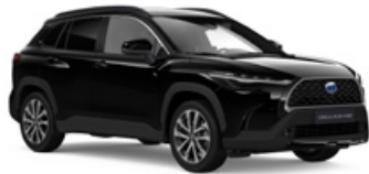
218 Čierna – klasická Metalický lak – 600 €