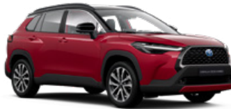
2YD Červená – rubínová s čiernou strechou Špeciálny lak pre Executive – 900 €