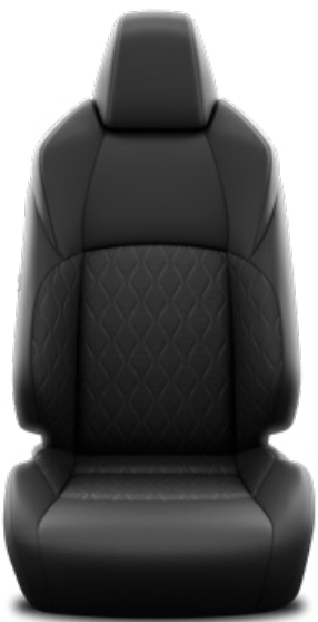
FA20 Textilné čalúnenie – čierne Pre výbavu Comfort a Style