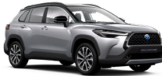
M12 Strieborná – metalická s čiernou strechou Metalický lak pre Executive – 900 €