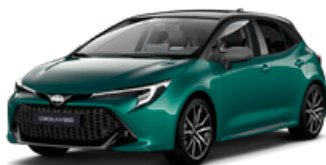
M28* Zelená – sýta so strechou v čiernej farbe (6P5/209) bez príplatku