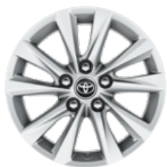
16" zliatinové disky kolies, pneumatiky 205/55 R16 Pre výbavu Comfort, paket Tech