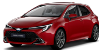
3U5 Červená – karmínová Špeciálny lak, 950 €