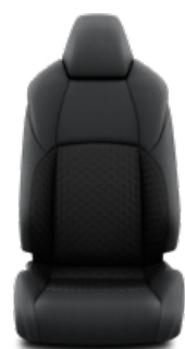
FB21 Látkové čalúnenie Pre výbavu Comfort, paket Tech