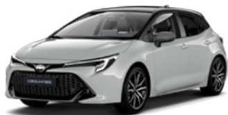
2RZ* Sivá – Dynamic so strechou v čiernej farbe (1K6/209) bez príplatku