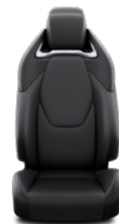
LC20 Čalúnenie syntetická koža čierne Pre výbavu Executive