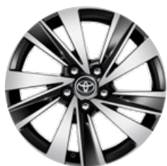
17" zliatinové disky kolies, pneumatiky 225/45 R17 Pre výbavu Style