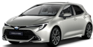
1J6 Strieborná – zamatová Špeciálny lak, 950 €