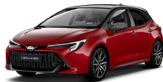
2SZ* Červená – karmínová so strechou v čiernej farbe (3U5/209) 300 €