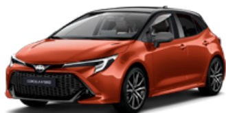
M42* Oranžová – sopečná so strechou v čiernej farbe (4Z3/209) 300 €