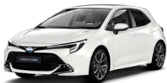
040 Biela – čistá Standardný lak, bez príplatku