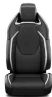
FC21 Čalúnenie textilné/syntetická koža v dizajne GR SPORT s červeným prešívaním Pre výbavu GR SPORT