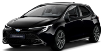
209 Čierna – nočná obloha Metalický lak, 650 €