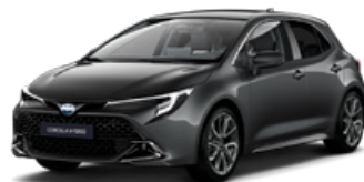
1G3 Sivá – popolavá Metalický lak, 650 €