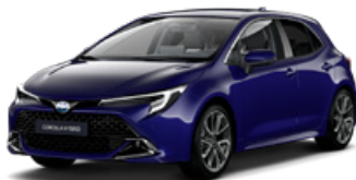
8Y8 Modrá – borievková Metalický lak, 650 €