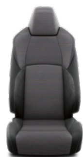
EB21 Látkové čalúnenie s prvkami syntetického semišu Dinamica® Pre výbavu Style