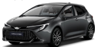
2MB* Sivá – popolavá so strechou v čiernej farbe (1G3/209) bez príplatku