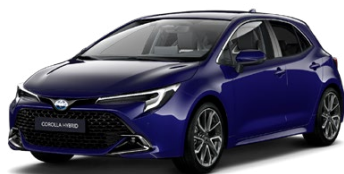
8Y8 Modrá – borievková Metalický lak, 650 €