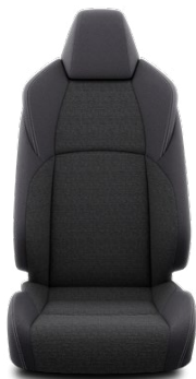
FD21 – Látkové čalúnenie čierne Pre výbavu Comfort