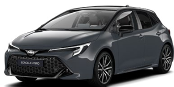
M52* Sivá – búrková so strechou v čiernej farbe (1M2/209) bez príplatku