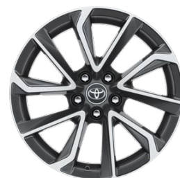
18" zliatinové disky kolies, pneumatiky 225/40 R18 Pre výbavu Executive