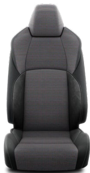
EB21 Látkové čalúnenie s prvkami syntetického semišu Dinamica® Pre výbavu Style