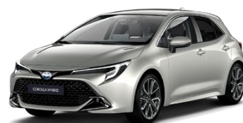
1J6 Strieborná – zamatová Špeciálny lak, 950 €