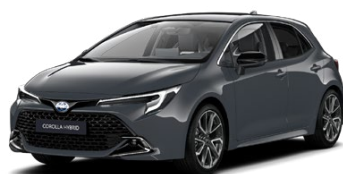
1M2 Sivá – búrková Metalický lak, 650 €