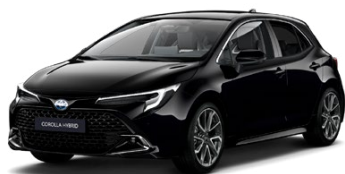
209* Čierna – nočná obloha Metalický lak, 650 €