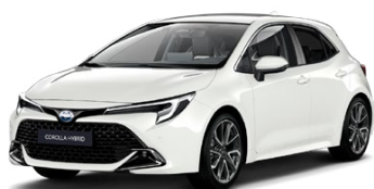
040 Biela – čistá Standardný lak, bez príplatku