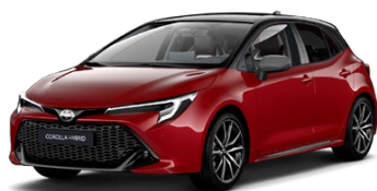
2SZ* Červená – karmínová so strechou v čiernej farbe (3U5/209) 300 €