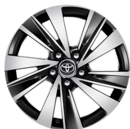
17" zliatinové disky kolies, pneumatiky 225/45 R17 Pre výbavu Style