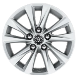
16" zliatinové disky kolies, pneumatiky 205/55 R16 Pre výbavu Comfort, paket Tech