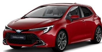
3U5 Červená – karmínová Špeciálny lak, 950 €