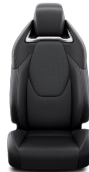
LC20 Čalúnenie syntetická koža čierne Pre výbavu Executive