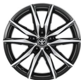
18" zliatinové disky kolies, pneumatiky 225/40 R18 Pre výbavu GR SPORT