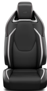
FC21 Čalúnenie textilné/syntetická koža v dizajne GR SPORT s červeným prešívaním Pre výbavu GR SPORT