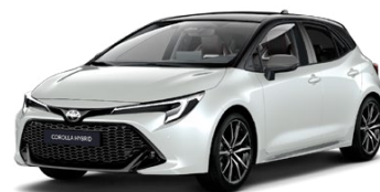
2PU* Biela – platinová so strechou v čiernej farbe (089/209) 300 €