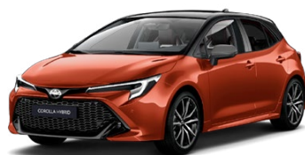
M42* Oranžová – sopečná so strechou v čiernej farbe (4Z3/209) 300 €