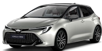
2RD* Strieborná – zamatová so strechou v čiernej farbe (1J6/209) 300 €