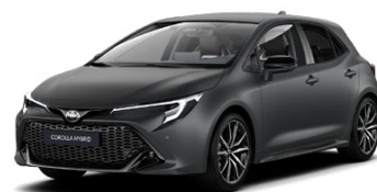
1M1* Sivá – matná Matný lak, 1500 €