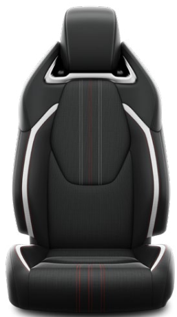
FC20 Čalúnenie textil/ syntetická koža čierno-sivé Pre výbavu GR SPORT