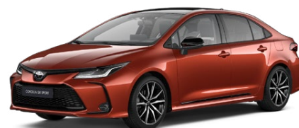
M35* Oranžová – sopečná s čiernou strechou (4Z3/202) Špeciálny lak pre GR SPORT 300 €