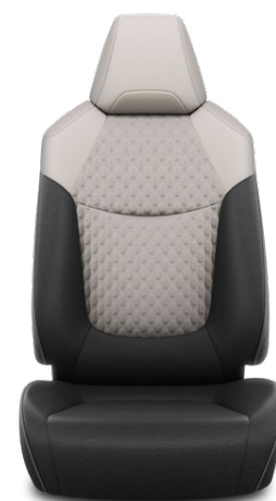
FB10 Čalúnenie textilné sivé Pre výbavu Comfort a Style