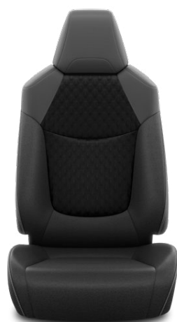
FB21 Čalúnenie textilné čierne Pre výbavu Comfort a Style