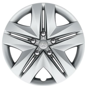
16" oceľové disky kolies s celoplošnými krytmi, pneumatiky 205/55 R16 Pre výbavu Active