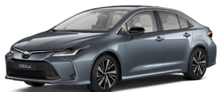
1K3 Sivá – celestín # Metalický lak 650 €