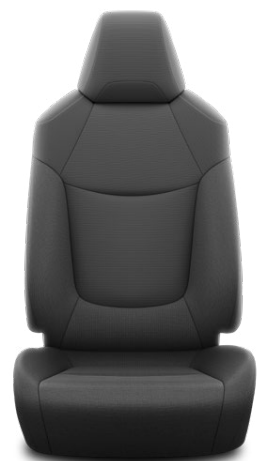
FA20 Čalúnenie textilné čierne Pre výbavu Active