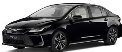
209 Čierna – nočná obloha Metalický lak 650 €