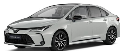
2VF Sivá – Dynamic s čiernou strechou (1K6/202) Metalický lak pre GR SPORT bez príplatku