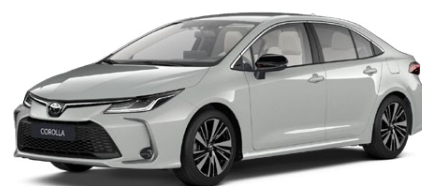
1K6 Sivá – Dynamic Metalický lak 650 €