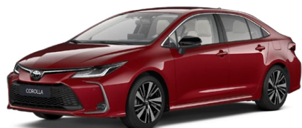
3U5 Červená – karmínová Špeciálny lak 950 €