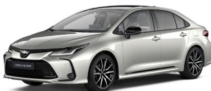
2MR Strieborná – zamatová s čiernou strechou (1J6/202) Špeciálny lak pre GR SPORT 300 €