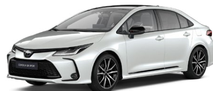
2VP Biela – platinová s čiernou strechou (089/202) Perleťový lak pre GR SPORT 300 €