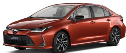
4Z3 Oranžová – sopečná § Špeciálny lak 950 €