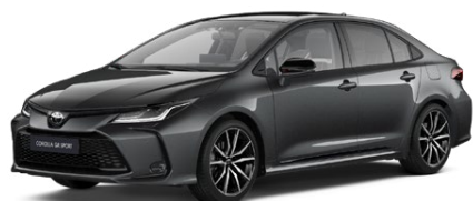
2NB Sivá – popolavá s čiernou strechou (1G3/202) Metalický lak pre GR SPORT bez príplatku