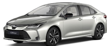
1J6 Strieborná – zamatová Špeciálny lak 950 €