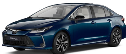
785 Modrozelená – tmavá Metalický lak 650 €