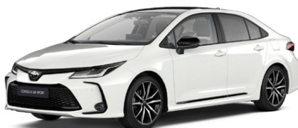
2MQ Biela – čistá s čiernou strechou (040/202) Štandardný lak pre GR SPORT bez príplatku