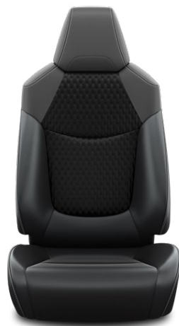
LA21 Čalúnenie textil/syntetická koža čierne Pre výbavu Executive