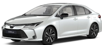
089 Biela – platinová Perleťový lak 950 €