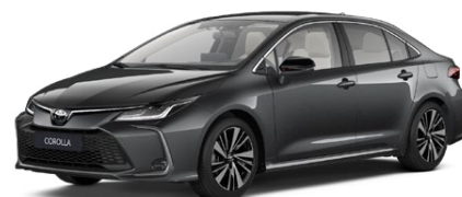
1G3 Sivá – popolavá Metalický lak 650 €