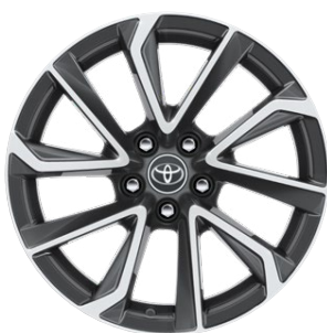
18" zliatinové disky kolies, pneumatiky 225/40 R18 Pre výbavu Executive