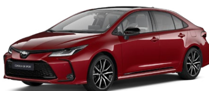
2TB Červená – karmínová s čiernou strechou (3U5/202) Špeciálny lak pre GR SPORT 300 €