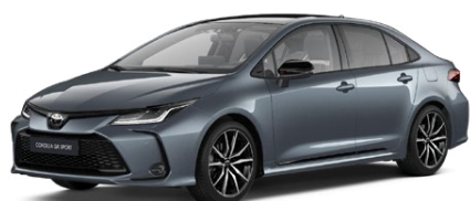
2TH Sivá – celestín s čiernou strechou (1K3/202) Metalický lak pre GR SPORT bez príplatku