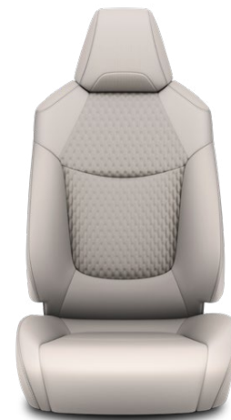
LA10 Čalúnenie textil/syntetická koža sivé Pre výbavu Executive