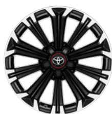
17" zliatinové disky kolies, pneumatiky 225/45 R17 Pre výbavu GR SPORT