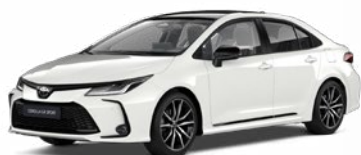
2MQ Biela – čistá s čiernou strechou Štandardný lak pre GR SPORT bez príplatku