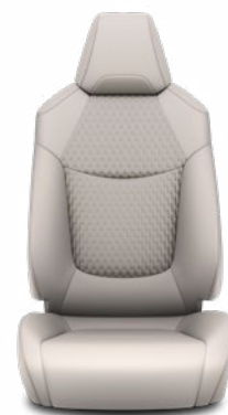
LA10 Čalúnenie textil/ syntetická koža sivé Pre výbavu Executive