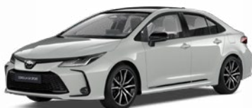
2VF Sivá – Dynamic s čiernou strechou Metalický lak pre GR SPORT bez príplatku