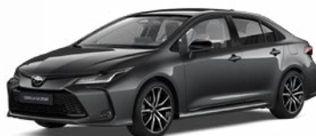
2NB Sivá – popolavá s čiernou strechou Metalický lak pre GR SPORT bez príplatku