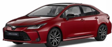
2TB Červená – karmínová s čiernou strechou Špeciálny lak pre GR SPORT 260 €