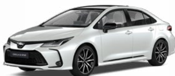
2VP Biela – platinová s čiernou strechou Perleťový lak pre GR SPORT 260 €