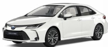
040 Biela – čistá Štandardný lak Bez príplatku