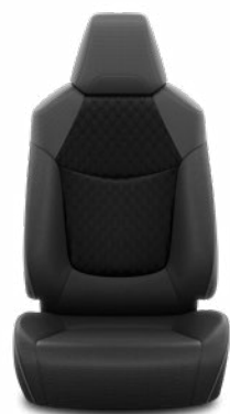
FB21 Čalúnenie textilné čierne Pre výbavu Comfort a Style