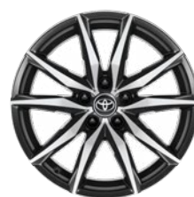
18" zliatinové disky kolies, pneumatiky 225/40 R18 V pakete Dynamic