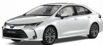
089 Biela – platinová Perleťový lak 780 €