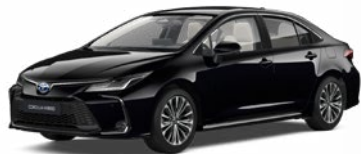
209 Čierna – nočná obloha Metalický lak 520 €