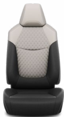
FB10 Čalúnenie textilné sivé Pre výbavu Comfort a Style