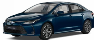
785 Modrozelená – tmavá Metalický lak 520 €