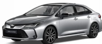
2VU Strieborná – metalická s čiernou strechou Metalický lak pre GR SPORT bez príplatku