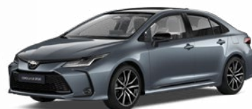
2TH Sivá – celestín s čiernou strechou Metalický lak pre GR SPORT bez príplatku