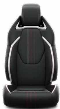
FC20 Čalúnenie textil/ syntetická koža čierno-sivé Pre výbavu GR SPORT