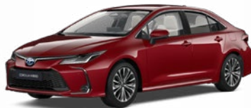
3U5 Červená – karmínová Špeciálny lak 780 €