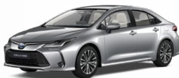
1L0 Strieborná – metalická Metalický lak 520 €