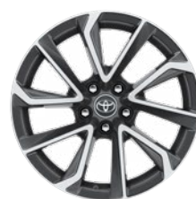
18" zliatinové disky kolies, pneumatiky 225/40 R18 Pre výbavu Executive