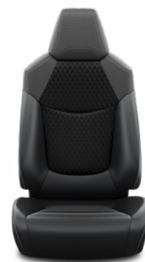
LA21 Čalúnenie textil/ syntetická koža čierne Pre výbavu Executive