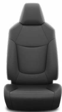
FA20 Čalúnenie textilné čierne Pre výbavu Active