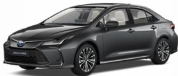
1G3 Sivá – popolavá Metalický lak 520 €