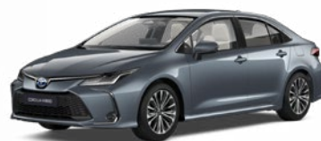
1K3 Sivá – celestín Metalický lak 520 €