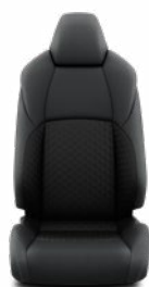
FB21 Látkové čalúnenie Pre výbavu Comfort, paket Tech