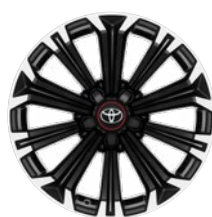
17" zliatinové disky kolies, pneumatiky 225/45 R17