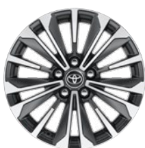
17" zliatinové disky kolies, pneumatiky 225/45 R17