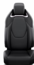
LC20 Čalúnenie syntetická koža čierne Pre výbavu Executive