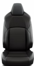
EA21 Čalúnenie textilné/syntetická koža čierne Pre výbavu Style