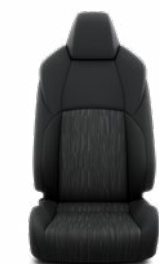
FA20 Látkové čalúnenie Pre výbavu Active