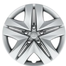
16" oceľové disky kolies s celoplošnými krytmi, pneu 205/55 R16