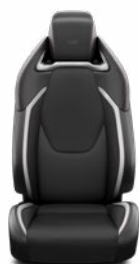
FC21 Čalúnenie textilné/syntetická koža v dizajne GR SPORT s červeným prešivaním Pre výbavu GR SPORT