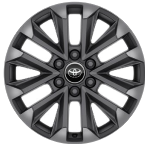
20" disky z ľahkých zliatin 265/60 R20 Pre výbavu Executive