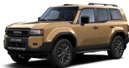
5C8 Žltá – Piesková metalický lak 1000 €