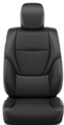
Syntetická koža – Čierna (20) Pre výbavu Invincible