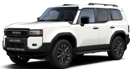
040 Biela – Čistá štandardný lak bez príplatku