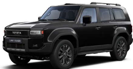
229 Čierna – Aura metalický lak 1000 €