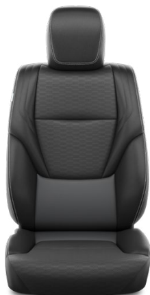
Prírodná koža – Čierna (20) Pre výbavu Executive