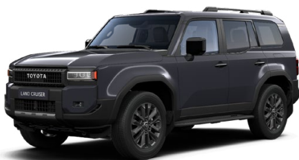
1L7 Šedá – Tmavá štandardný lak 1000 €