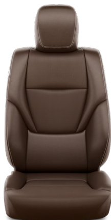
Syntetická koža – Gaštanová (40) Pre výbavu Invincible