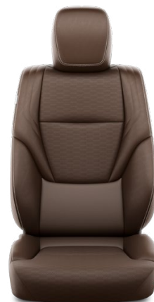
Prírodná koža – Gaštanová (40) Pre výbavu Executive