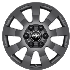
18" disky z ľahkých zliatin 265/65 R18 Pre výbavu Invincible