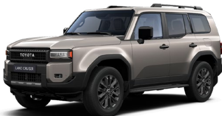
4V8 Bronzová – Avant Garde metalický lak 1000 €