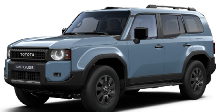
8X0 Dymová Modrá štandardný lak, iba pre Invincible 1000 €