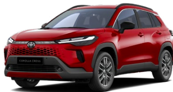
3U5 Červená – karmínová Špeciálny lak – 950 € Pre výbavy Style, Executive