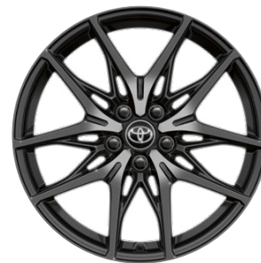
19" zliatinové disky kolies GR SPORT Pneumatiky 225/45 R19 Pre výbavu GR SPORT