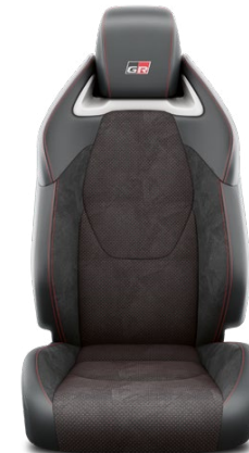
EA20 Čalúnenie semišom Ultrasuede™ s bočnicami so syntetickej kože – čierne Pre výbavu GR SPORT