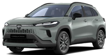
6X3 Sivá – khaki Štandardný lak – 650 € Pre výbavu Executive - bez príplatku