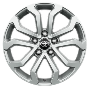
17" zliatinové disky kolies Pneumatiky 215/60 R17 Pre výbavu Comfort