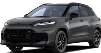
M29 Sivá – búrková s čiernou strechou (1M2/202) Metalický lak – bez príplatku Pre výbavu GR SPORT