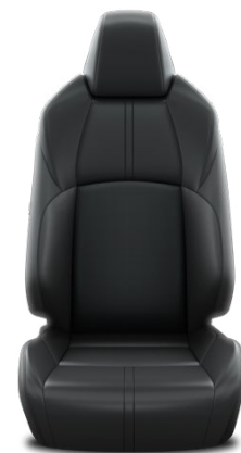
LB20 Kožené čalúnenie – čierne (prírodná a syntetická koža) Pre výbavu Executive