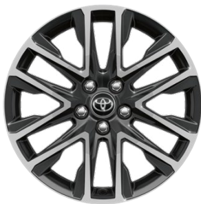
18" zliatinové disky kolies Pneumatiky 225/50 R18 Pre výbavy Style a Executive