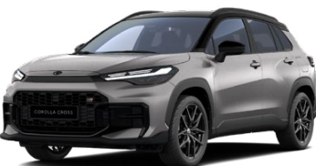
2NK Strieborná – kovová s čiernou strechou (1K0/202) Metalický lak – bez príplatku Pre výbavu GR SPORT