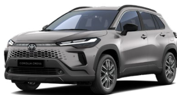
1K0 Strieborná – kovová Metalický lak – 650 € Pre výbavy Comfort, Style, Executive