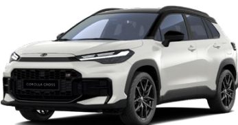
2VP Biela – platinová s čiernou strechou (089/202) Perleťový lak – bez príplatku Pre výbavu GR SPORT