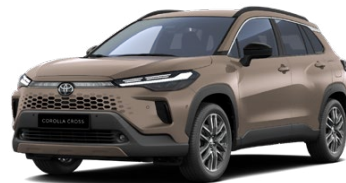
4Z2 Hnedá – bahenná Metalický lak – 650 € Pre výbavy Comfort, Style, Executive