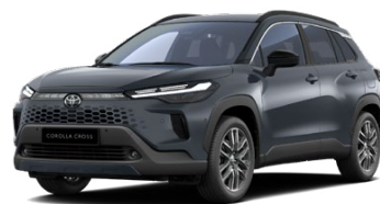
1L6 Modrosivá – oceleťová Metalický lak – 650 € Pre výbavy Comfort, Style, Executive