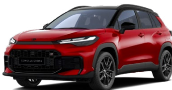
2TB Červená – karmínová s čiernou strechou (3U5/202) Špeciálny lak – bez príplatku Pre výbavu GR SPORT