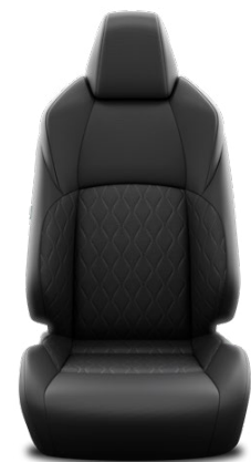
FA20 Textilné čalúnenie – čierne Pre výbavy Comfort a Style