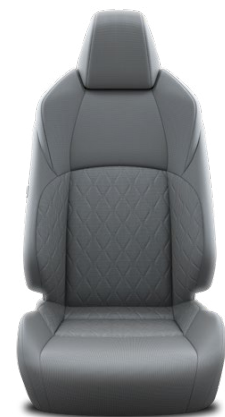
FA10 Textilné čalúnenie – sivé Pre výbavy Comfort a Style