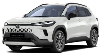
040 Biela – čistá Štandardný lak – bez príplatku Pre výbavu Comfort, Style