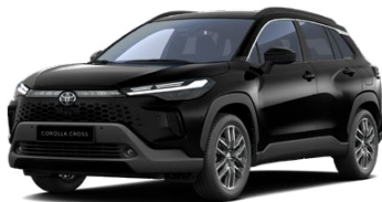
209 Čierna – nočná obloha Metalický lak – 650 € Pre výbavy Comfort, Style, Executive