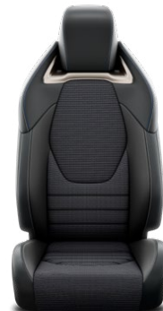
EA20 Čierne textilné čalúnenie s bočnicami zo syntetickej kože a semišu Pre výbavu Executive