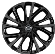
19" zliatinové disky kolies GR SPORT s pneumatikami 225/50 R19 Pre výbavu GR SPORT