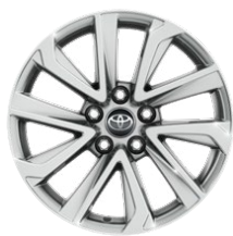
17" zliatinové disky kolies s pneumatikami 215/60 R17 Pre výbavu Comfort, Comfort Plus