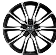
20" zliatinové disky kolies GR SPORT s pneumatikami 245/40 R20 Pre výbavu GR SPORT s paketom Dynamic