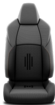
FB20 Čierne textilné čalúnenie Pre výbavy Comfort Plus, Style