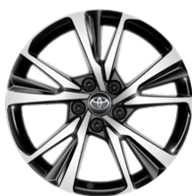
18" zliatinové disky kolies s pneumatikami 225/55 R18 Pre výbavu Style