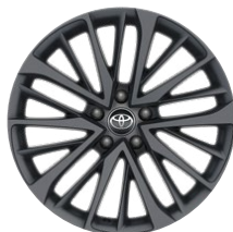
19" matné šedé disky kolies s pneumatikami 225/50 R19 Pre výbavu Tokyo Edition