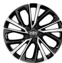
19" zliatinové disky kolies s pneumatikami 225/50 R19 Pre výbavu Executive