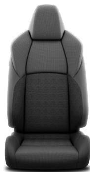
FA20 Čierne textilné čalúnenie Pre výbavu Comfort