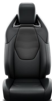
LB20 Čierne kožené čalúnenie zo syntetickej kože Pre výbavu Executive s paketom Tech