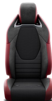
ED20 Čierne kožené čalúnenie s bordovým prešívaním a prvkami semišu Dinamica® Pre výbavu Tokyo Edition