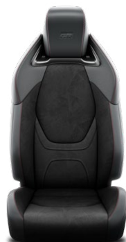
EB20 Čierne čalúnenie eko semišom Ultrasuede s červeným prešívaním Pre výbavu GR SPORT