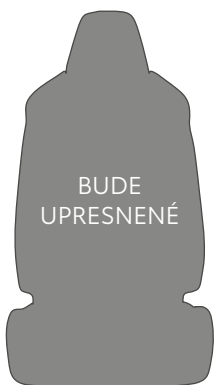
FB20 Čierne látkové čalúnenie Pre výbavu Active a Comfort