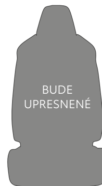
EB21 Čierne látkové čalúnenie s khaki detailmi s bočnicami zo syntetickej kože a sivým prešivaním Pre výbavu Premiere Edition