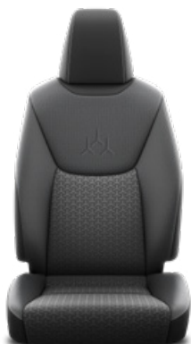
FC20 Čierno-sivé látkové čalúnenie so sivým prešivaním Pre výbavu Style