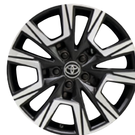
18" zliatinové disky kolies, pneumatiky 215/50 R18 Pre výbavu Premiere Edition