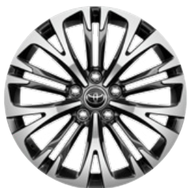
18" zliatinové disky kolies, pneumatiky 215/50 R18 Pre výbavu Executive