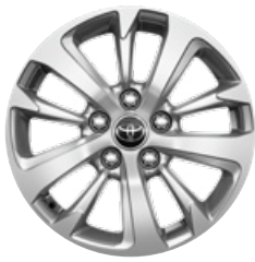
16" zliatinové disky kolies, pneumatiky 205/65 R16 Pre výbavu Comfort