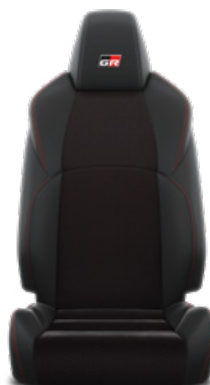
EC20 Čierne perforované čalúnenie z ekologického semišu Ultrasuede™ s bočnicami zo syntetickej kože a červeným prešivaním Pre výbavu GR SPORT