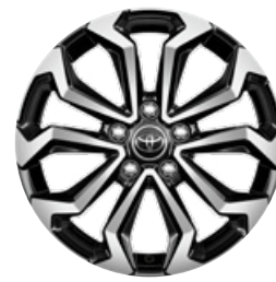
17" zliatinové disky kolies, pneumatiky 215/55 R17 Pre výbavu Style