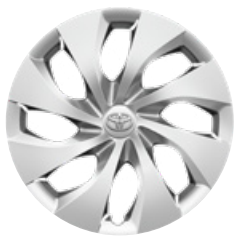
16" ocelové disky kolies s ozdobnými krytmi, pneumatiky 205/65 R16 Pre výbavu Active