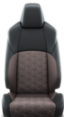
EA40 Sivohnedé látkové čalúnenie v kombinácii s čiernou kožou a bielym prešivaním Pre výbavu Executive