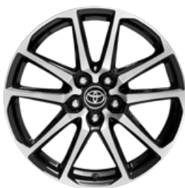
18" zliatinové disky kolies, pneumatiky 215/50 R18 Pre výbavu GR SPORT