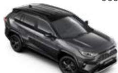
2QZ Sivá – popolavá so strechou v čiernej farbe*** Dvojfarebný lak pre výbavu Selection 600 €