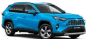
8W9 Modrá – azúrová Metalický lak 600 €