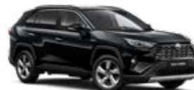
218 Čierna – klasická Metalický lak 600 €