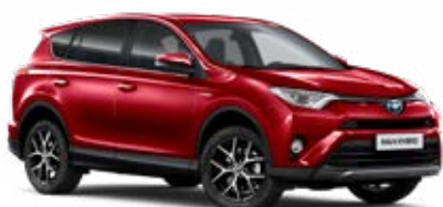
3T3 Červená – rubínová**