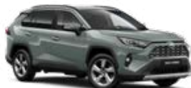
6X3 Sivá – khaki Matný lak 600 €