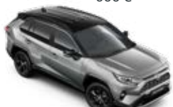
2QY Strieborná – zirkónová so strechou v čiernej farbe*** Dvojfarebný lak pre výbavu Selection 600 €