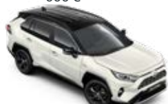
2QJ Biela – perleťová so strechou v čiernej farbe*** Dvojfarebný lak pre výbavu Selection 600 €