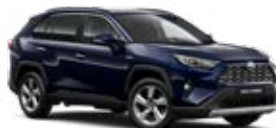
8X8 Modrá – elitná Metalický lak 600 €