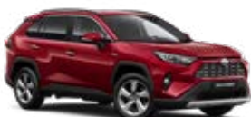
3T3 Červená – rubínová Špeciálny lak 900 €