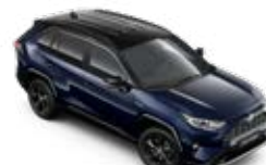
2RA Modrá – elitná so strechou v čiernej farbe*** Dvojfarebný lak pre výbavu Selection 600 €