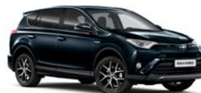
221 Modrá – tmavá hlbinná*