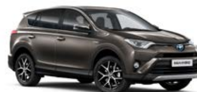
4U5 Hnedá – tmavá*

* Metalický lak karosérie. ** Perleťový a špeciálny lak karosérie.