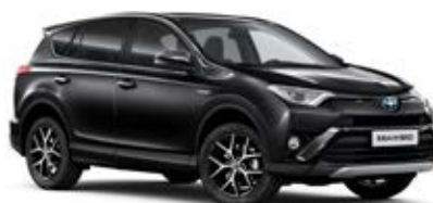
209 Čierna – nočná obloha*