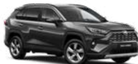
1G3 Sivá – popolavá Metalický lak 600 €