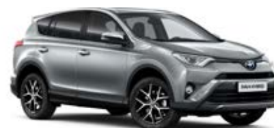
1D6 Strieborná – zirkónová*