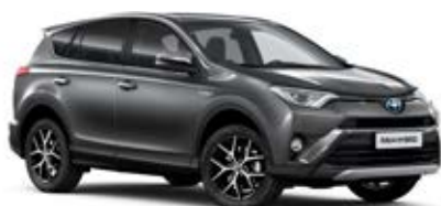
1G3 Sivá – popolavá*