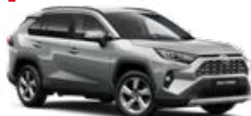
1D6 Strieborná – zirkónová Metalický lak 600 €