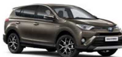
4T3 Běžová – cappuccino*