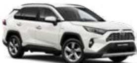
040 Biela – čistá Štandardný lak Bez príplatku