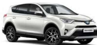
070 Biela – perleťová**