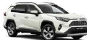
070 Biela – perleťová Perleťový lak 900 €