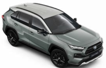
2QU Sivá – khaki so strechou v sivej farbe dostupný len pre výbavu Adventure, bez príplatku