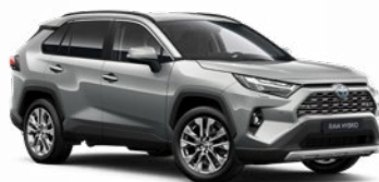
1D6 Strieborná – zirkónová Metalický lak 700 €