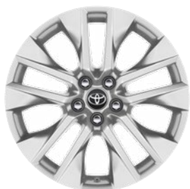
19" zliatinové disky kolies 235/55 R19 Štandard vo výbave Executive