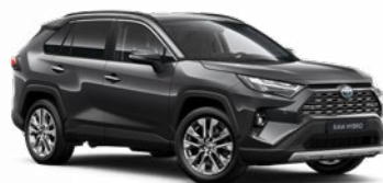
1G3 Sivá – popolavá Metalický lak, 700 € pre výbavu Adventure bez príplatku