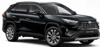
218 Čierna – klasická Metalický lak, 700 € pre výbavu Adventure bez príplatku