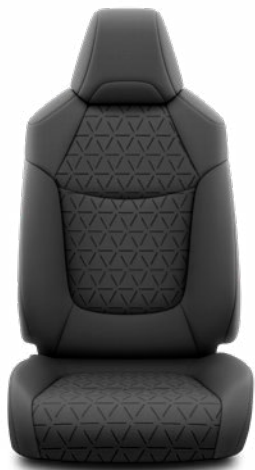
FA20 Textilné čalúnenie v čiernej farbe Štandard vo výbave Comfort a v pakete Style