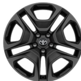
19" čierne zliatinové disky kolies 235/55 R19 Štandard vo výbave Adventure