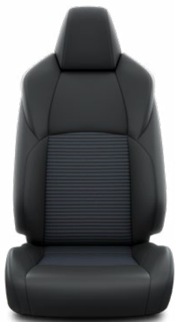
EC20 Čalúnenie z umelej kože v kombinácii s látkou Štandard vo výbave Selection