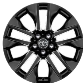
19" čierne zliatinové disky kolies 235/55 R19 Štandard vo výbave Selection