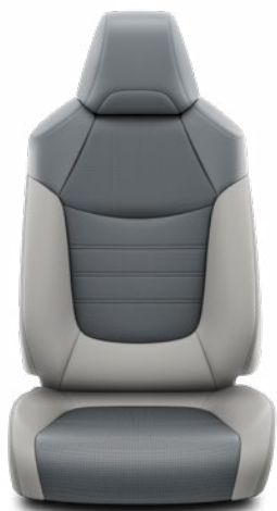
LA10 Čalúnenie v kombinácii prírodnej a syntetickej kože sivé Štandard vo výbave Executive