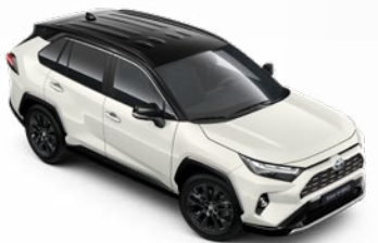
2PS Biela – platinová so strechou v čiernej farbe dostupný len pre výbavu Selection a GR SPORT 300 €