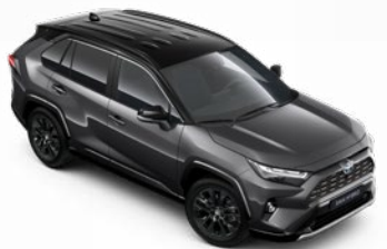
2QZ Sivá – popolavá so strechou v čiernej farbe dostupný len pre výbavu Selection a GR SPORT bez príplatku