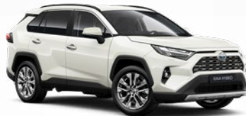
089 Biela – platinová Perleťový lak 1000 €