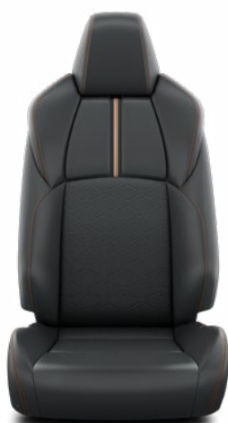
EB20 Čalúnenie z umelej kože Štandard vo výbave Adventure