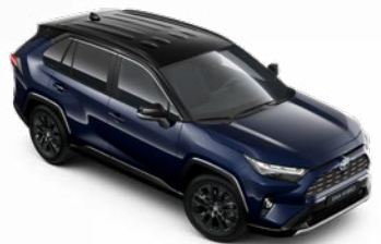
2RA Modrá – elitná so strechou v čiernej farbe dostupný len pre výbavu Selection a GR SPORT bez príplatku