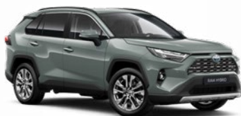
6X3 Sivá – khaki Matný lak, 700 € pre výbavu Adventure bez príplatku