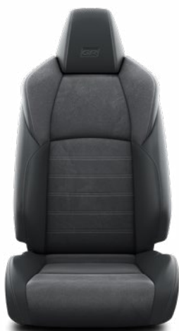
EF20 Čalúnenie v kombinácii syntetickej kože a Alcantara Štandard vo výbave GR SPORT