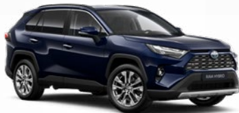
8X8 Modrá – elitná Metalický lak 700 €