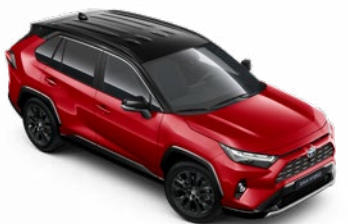
2SC Červená – karmínová so strechou v čiernej farbe dostupný len pre výbavu GR SPORT, 300 €