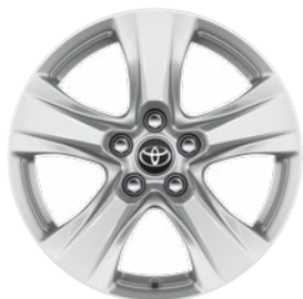
17" zliatinové disky kolies 225/65 R17 Štandard vo výbave Comfort