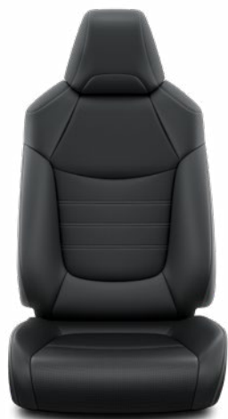
LA20 Čalúnenie v kombinácii prírodnej a syntetickej kože čiernej Štandard vo výbave Executive