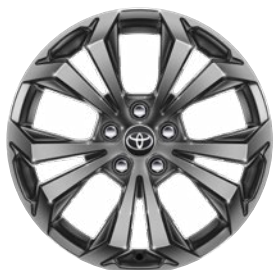
18" zliatinové disky kolies 225/60 R18 Štandard v pakete Style