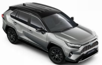
2QY Strieborná – zirkónová so strechou v čiernej farbe dostupný len pre výbavu Selection a GR SPORT bez príplatku