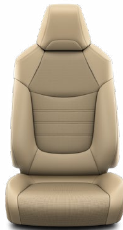
LA40 Čalúnenie v kombinácii prírodnej a syntetickej kože béžového Štandard vo výbave Executive