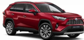
3T3 Červená – rubínová Špeciálny lak, 1000 € pre výbavu Adventure 300 €