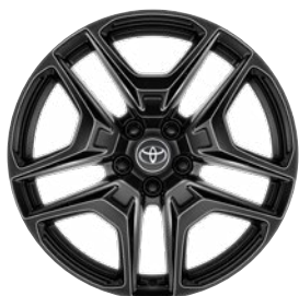
19" čierne zliatinové disky kolies 235/55 R19 Štandard vo výbave GR SPORT