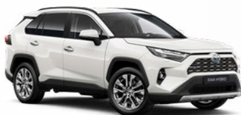
040 Biela – čistá Štandardný lak Bez príplatku