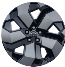
19" čierno-sivé zliatinové disky kolies s aerodynamickými krytmi (5 lúčov), pneumatiky 225/50 R19 Štandard pre výbavu Executive