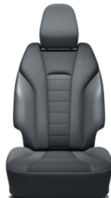
Látkové čalúnenie sedadiel v kombinácii so syntetickou kožou Štandard pre výbavu Executive