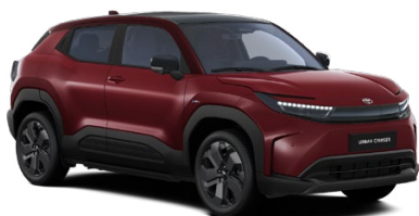
E86 Červená – orientálna s čiernou strechou Metalický lak 600 € – Executive