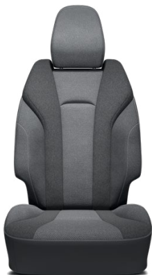
Látkové čalúnenie sedadiel Štandard pre výbavu Style