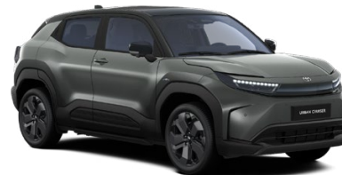
FDC Zelená – šalviová s čiernou strechou Metalický lak 600 € – Executive