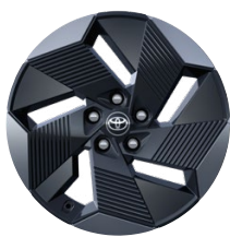
18" čierno-strieborné zliatinové disky kolies s aerodynamickými krytmi (5 lúčov), pneumatiky 225/55 R18 Štandard pre výbavu Style