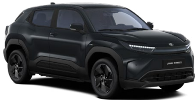
WB3 Čierna – tmná Špeciálny metalický lak 850 € – Style, Executive