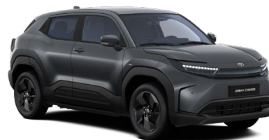
WBF Sivá – ušľachtilá Metalický lak 600 € – Style, Executive