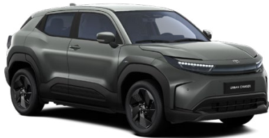
WA1 Zelená – šalviová Metalický lak 600 € – Style, Executive