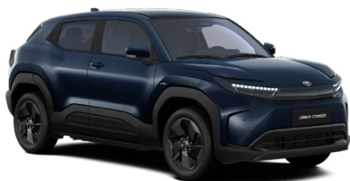
WBH Modrá – éterická Štandardný lak bez príplatku – Style, Executive