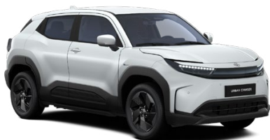
WBE Strieborná – žiarivá Metalický lak 600 € – Style, Executive