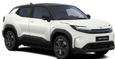
E5G Biela – arktická s čiernou strechou Perleťový lak 850 € – Executive