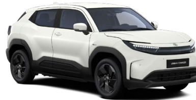
ZHJ Biela – arktická Perleťový lak 850 € – Style, Executive