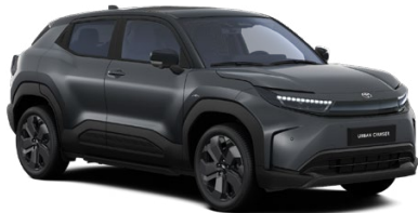
FFZ Sivá – ušľachtilá s čiernou strechou Metalický lak 600 € – Executive