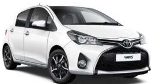
040 Biela – čistá

(k dispozícii podľa skladovej dostupnosti)