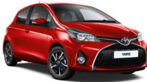
3P0 Červená – ohnivá