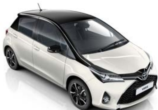
2NS Biela – ľadovcová** a Čierna – nočná obloha*

* Metalický lak karosérie ** Perleťový lak karosérie